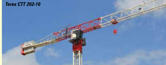
Terex CTT 202-10

10t LRH174 hydraulic luffer, a new flat top and regular luffer. Across the aisle Comansa has the new 50t 21LC1050 flat top with 80m jib. Jaso opposite has an upgraded J560 with modular counter jib and 'lay flat' counterweights. Finally in the south east corner Potain has three new cranes - a flat top, a luffer and a larger Hup self-erector.