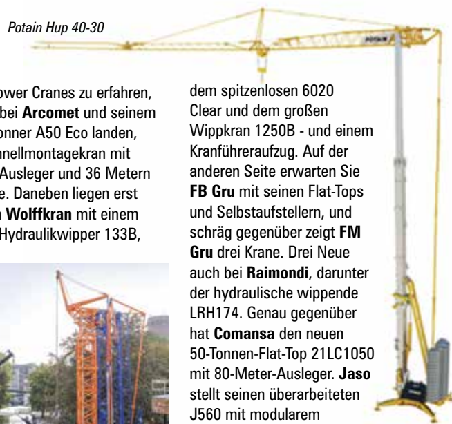
Potain Hup 40-30

Wilbert Tower Cranes zu erfahren, bevor wir bei Arcomet und seinem neuen 8-Tonner A50 Eco landen, einem Schnellmontagekran mit 50-Meter-Ausleger und 36 Metern Hakenhöhe. Daneben liegen erst BBL , dann Wolffkran mit einem Trio: dem Hydraulikwipper 133B,