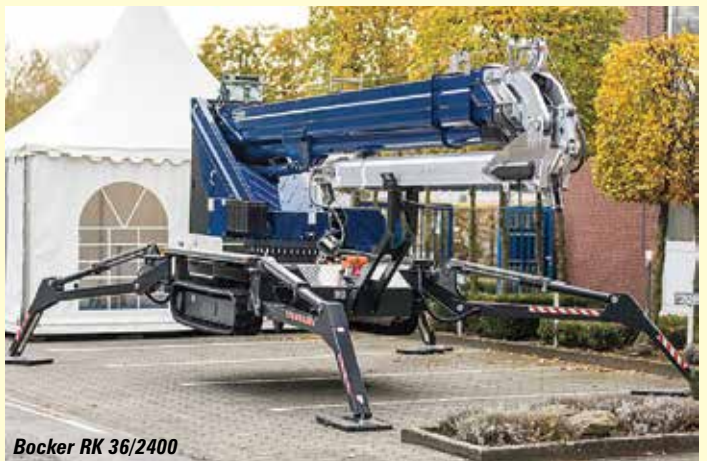
Böcker RK 36/2400

five section 19.4 metre boom and can pick & carry 3.5 tonnes. Also check two updated spider cranes, the 3.8 tonne MC405C-3 and the 2.82 tonne MC285C-3. New features include slew limit setting, 7 inch display, HBC radio remote controls, multi-position outrigger system and EU Stage V diesel. Next door to Wolffkran Brennero/BG Lift to see the 14.5 tonnes Effer based CWE 525 articulated spider crane and