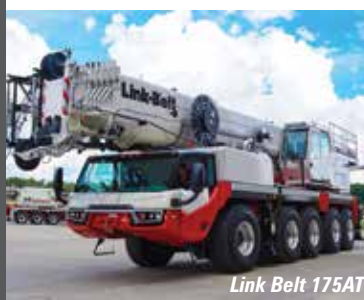
Link Belt 175AT