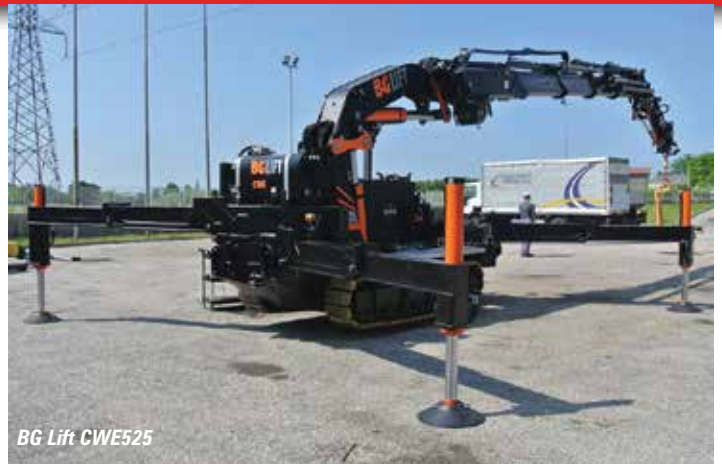
BG Lift CWE525

Batterie ausgestattete 3,2-Tonnen-Spinnenkran SPX532. Dahinter könnte Hoeflon einen Prototyp seines innovativen 8-Tonnens C30 zeigen. Auf der anderen Seite des Ganges stellen Maeda und Kranlyft den neuen CC1908 vor, mit 8,1 Tonnen Tragkraft ihr bisher größter „Mini“. Er hat einen fünfteiligen 19,4 Meter langen Ausleger und