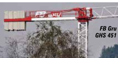
FB Gru GHS 451

hochfestem Faserseil für höhere Traglasten, längere Lebensdauer und einfachere Handhabung. Die acht Modelle reichen vom 6-Tonnen-„Citykran“ bis hin zum 16-Tonner mit Spitzentraglasten von 1,6 bis 2,8 Tonnen und Auslegerlängen bis 78 Meter. Auch von Interesse: die neue Kabine und die „intuitive Benutzeroberfläche“. Weiter geht es ins Freigelände Süd zu Zoomlion , um mehr über die Akquisition von