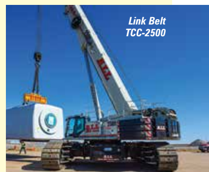
Link Belt TCC-2500