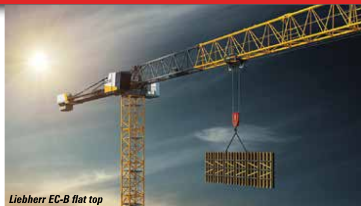
Liebherr EC-B flat top