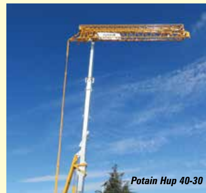
Potain Hup 40-30

10t LRH174 hydraulic luffer, a new flat top and regular luffer. Across the aisle Comansa has the new 50t 21LC1050 flat top with 80m jib. Jaso opposite has an upgraded J560 with modular counter jib and 'lay flat' counterweights. Finally in the south east corner Potain has three new cranes - a flat top, a luffer and a larger Hup self-erector.