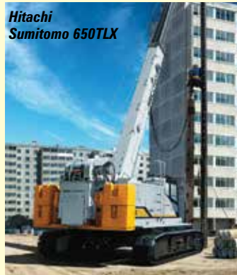
Hitachi Sumitomo 650TLX

Close by you find XCMG which is keeping quiet about new cranes, so we head a few blocks east to Tadano to learn more about its plans with Demag and to see its 80 tonne GTC-800 telescopic crawler. Next we