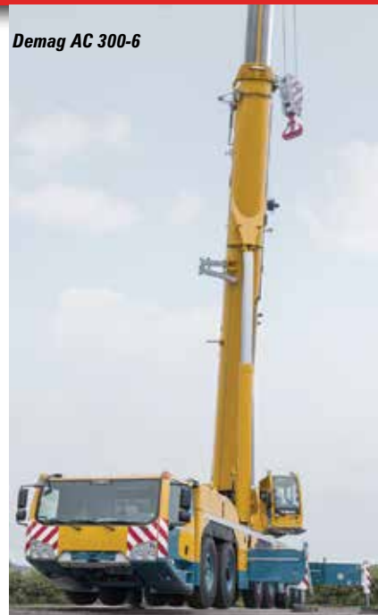
Demag AC 300-6

GMK3060L mit 48-Meter-Ausleger, Euromot 5 Diesel und der variablen Abstützung Maxbase. Auch der 90-Tonner auf vier Achsen - GMK4090 - ist am Start.