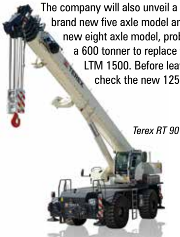
Terex RT 90

From the Vertikal stand we head north to Terex and Demag where the big news is the sale of the Demag business to Tadano later this year. A new Demag All Terrain crane will be unveiled, details of which it is keeping secret, and there will be an upgraded version of its Terex RT90 Rough Terrain with new operating system. Check the Demag AC45 City and take a look at its new IC1 with remote controls and updated telematics. We now cross the aisle to Sennebogen before entering the massive Liebherr stand, where you will find two new All Terrains including the 230 tonne five axle LTM1230-5.1 with a 75 metre boom. The company will also unveil a brand new five axle model and a new eight axle model, probably a 600 tonner to replace the LTM 1500. Before leaving check the new 125K,