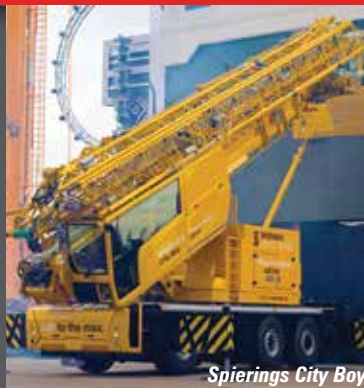
Spierings City Boy