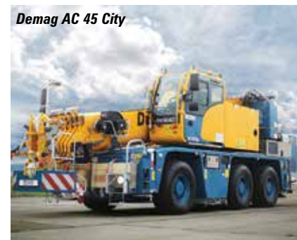
Demag AC 45 City