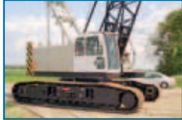
SCX800 80t 2009