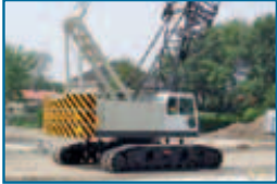
SCX900 90t 2008