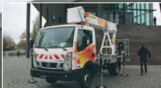
Farbenfroh: Palfingers brandneue 25-Meter-Bühne P 250 BK