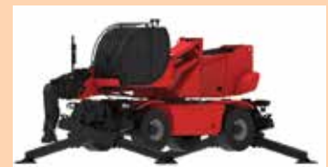
Magni TH 36 fixed telescopic

Finalement arrêtons-nous chez Zoomlion pour voir son tout nouveau modèle compact ZTH 2506, de 2.500kg/6 mètre