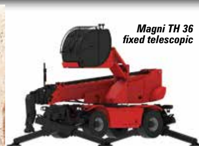
Magni TH 36 fixed telescopic

Next stop on our tour is Sany to see the first models in its new line up of European telehandlers, starting with two 4,000kg models - the 14 metre STH1440 and 18 metre STH1840. Finally stop by Zoomlion to see its all-new 2,500kg/6m ZTH2506 compact model, and ask about its plans for further models, possibly even an electric version.