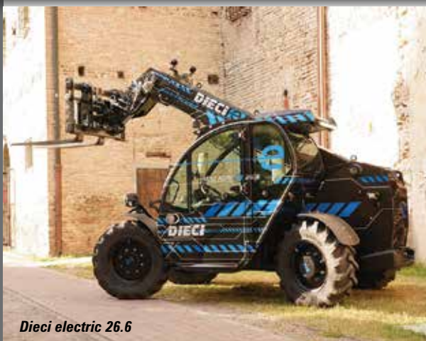
Dieci electric 26.6

Telehandlers are one of the more represented lifting related products at this year's show, even though the two largest manufacturers - JCB and Manitou - are not attending. Despite this there are plenty of new products to see. The main areas are Hall 5b - alongside the Vertikal booth and directly outside in External area 5.