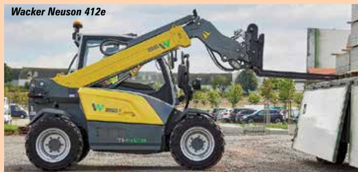
Wacker Neuson 412e