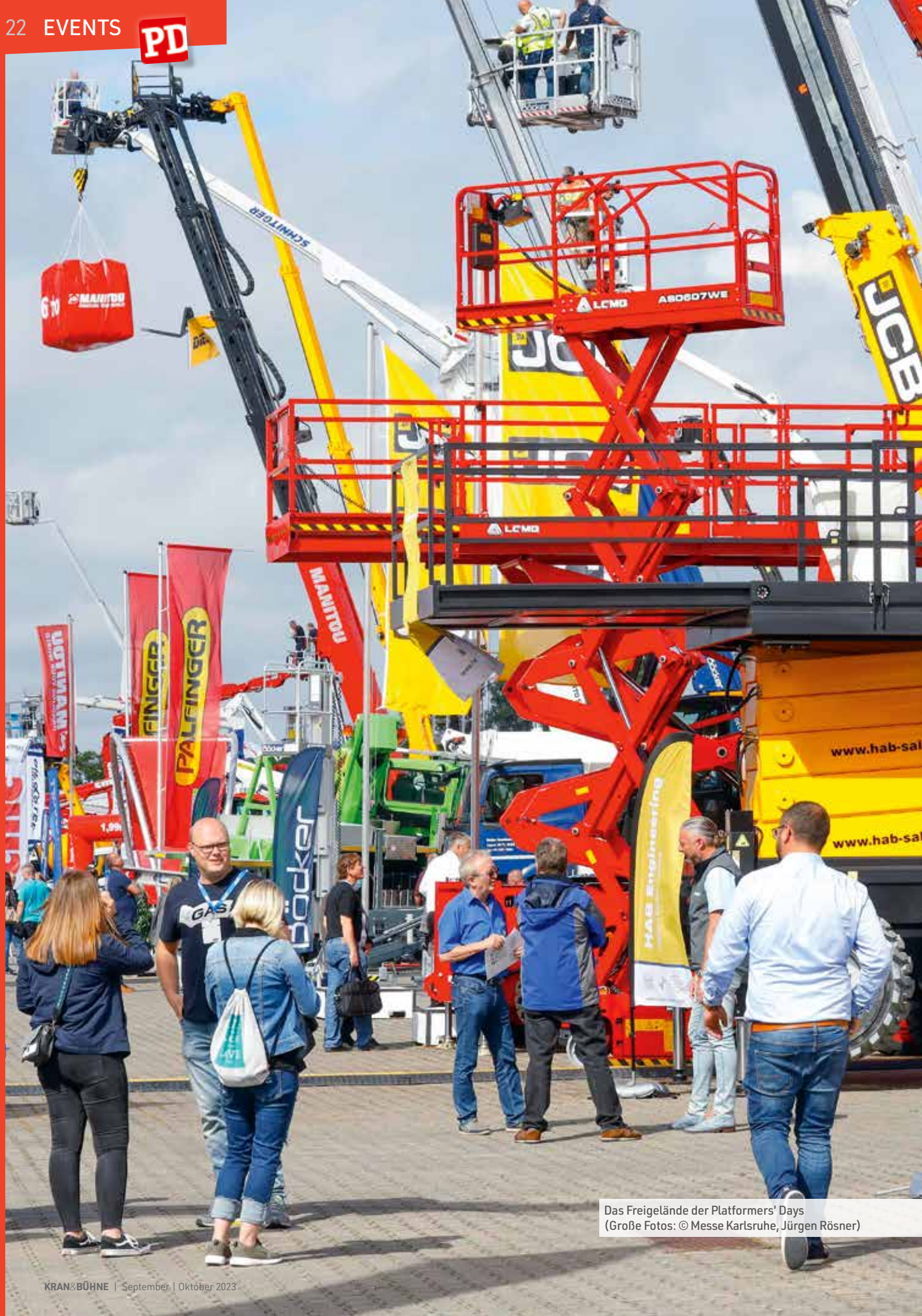
Das Freigelände der Platformers' Days