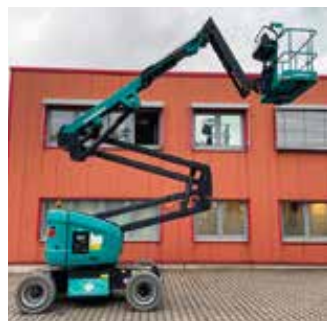
siehe Mini & Mobile Cranes