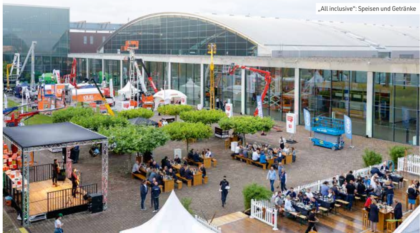
„All inclusive“: Speisen und Getränke