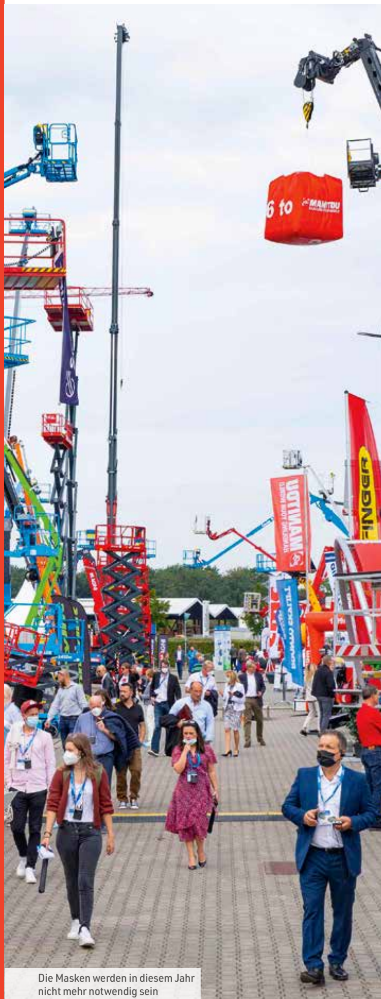
Die Masken werden in diesem Jahr nicht mehr notwendig sein