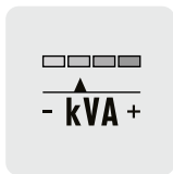
Terex Power Match