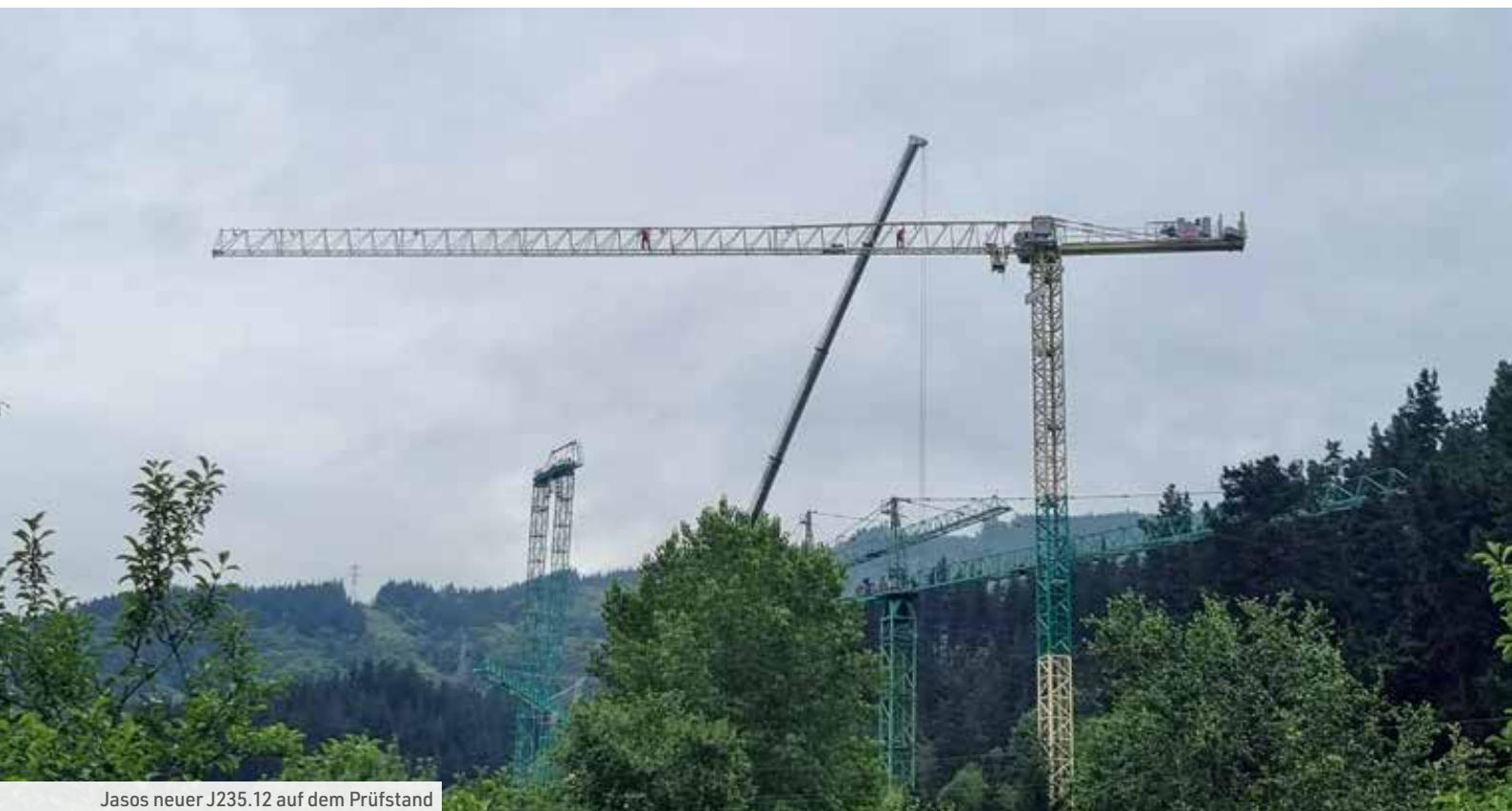
Jasos neuer J235.12 auf dem Prüfstand

Zunächst wurde hierfür ein Betonfundament mit verpressten Mikropfählen errichtet und darauf das Portal mit den Maßen 6 x 6 Meter gepackt. Die Mikropfähle haben einen Durchmesser von weniger als 30 Zentimeter. Die Fundamente befinden sich ausschließlich auf den Wegen, so bleiben die Gräber unberührt. Ein Mobilkran platzierte dann auf dem Portal einen Flat-Top-Kran 250 EC-B mit 21-HC-Turmsystem, 65-Meter-Ausleger und Unterwagen. Dank dieses Konzepts steht der gut 50 Meter hoch aufgebaute 12-Tonner stabil und kann über den Gräbern arbeiten. An der Spitze hebt er bis zu 2.850 Kilogramm. Intelligente Assistenzsysteme wie Micromove helfen dem Kranfahrer dabei, das Baumaterial präzise und sanft abzusetzen. Gerade bei Arbeiten an denkmalgeschützten Gebäuden ist das wichtig, um Schäden zu vermeiden. Die Sanierung dauert ungefähr ein Jahr; voraussichtlich im Frühjahr 2024 wird der Kran demontiert. ↘