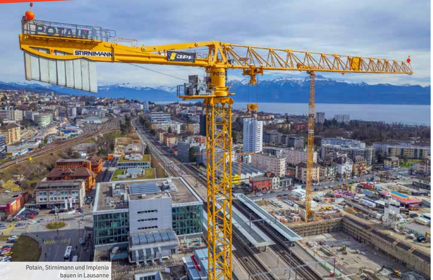
Potain, Stirnimann und Implenia bauen in Lausanne