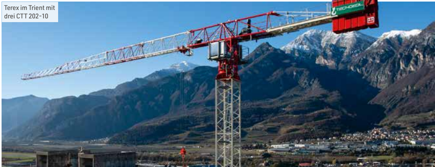
Terex im Trient mit drei CTT 202-10