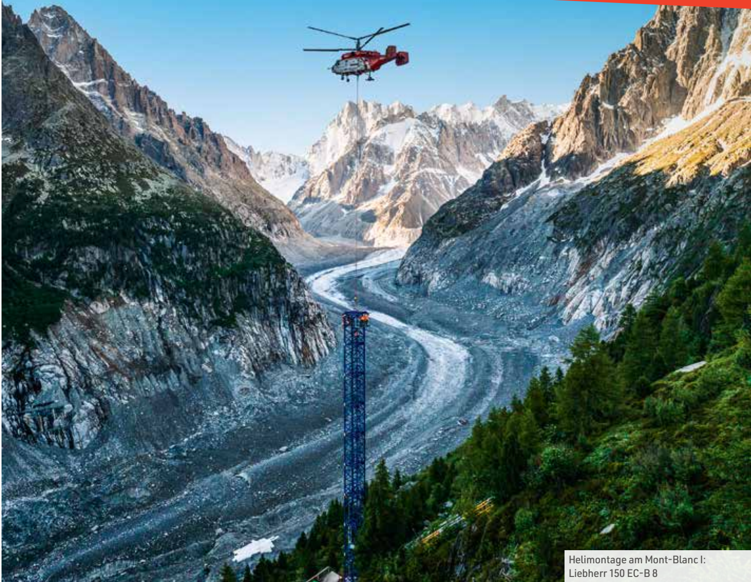
Helimontage am Mont-Blanc I: Liebherr 150 EC-B 8