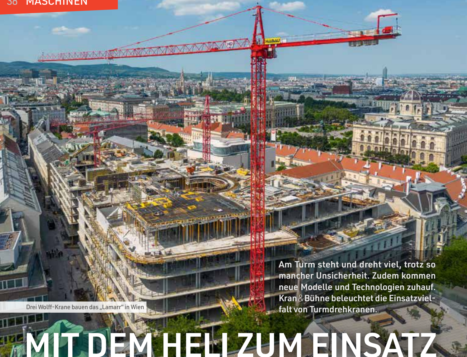
Drei Wolff-Krane bauen das „Lamarr“ in Wien

Am Turm steht und dreht viel, trotz so mancher Unsicherheit. Zudem kommen neue Modelle und Technologien zuhauf. Kran & Bühne beleuchtet die Einsatzvielfalt von Turmdrehkränen.