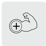
Terex Power Plus

TEREX bietet ein komplettes Programm an Flat-Top-Turmdrehkränen der City-Klasse mit Tragfähigkeiten von 5 bis 10 t. Mit ihrem modularen Konzept lassen sie sich schnell an die Anforderungen unterschiedlichster Baustellen anpassen. Terex Power Plus (TPP) steigert die Arbeitsleistung des Krans im Bedarfsfall um zusätzliche 10 %. Die T-Torque Schwenktechnologie bietet Kranfahrern hochpräzise Kontrolle über Lastenhandling und -positionierung.