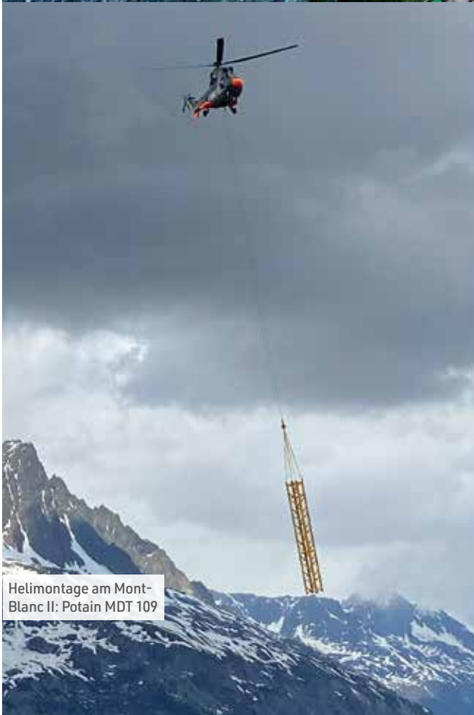
Helimontage am Mont-Blanc II: Potain MDT 109

Schließlich kam der 150 EC-B ins Spiel, weil der Gegenausleger mit 3.600 Kilogramm nicht zu schwer für den Helitransport ist. Zudem kann der Flat-Top-Kran mühelos in mehrere Einzelteile zerlegt werden. Elemente wie Kompaktkopf, Drehbühne, Kabine und Schaltschrank lassen sich schnell wieder miteinander verbinden. Gleichzeitig aber mussten auch Architekten und Baufirma das Konzept für die Baustelle so anpassen, dass die zu bewegenden Lasten die maximale Tragfähigkeit des Krans in Höhe von acht Tonnen nicht überschreiten. Dies gelang unter anderem durch den Einsatz leichterer Betonelemente. ↘