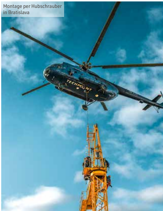
Montage per Hubschrauber in Bratislava