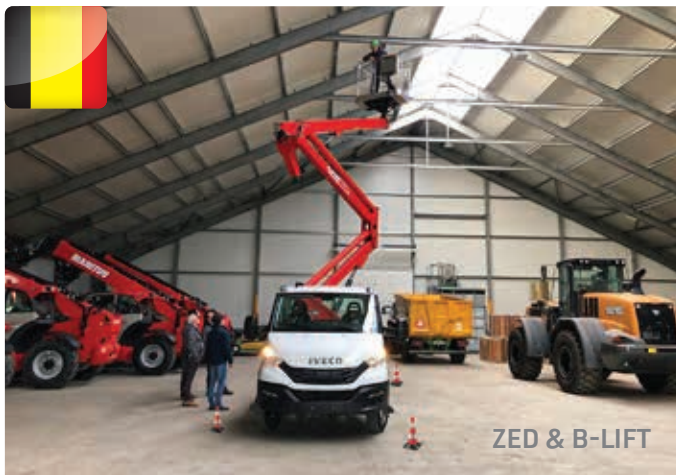
ZED &amp; B-LIFT