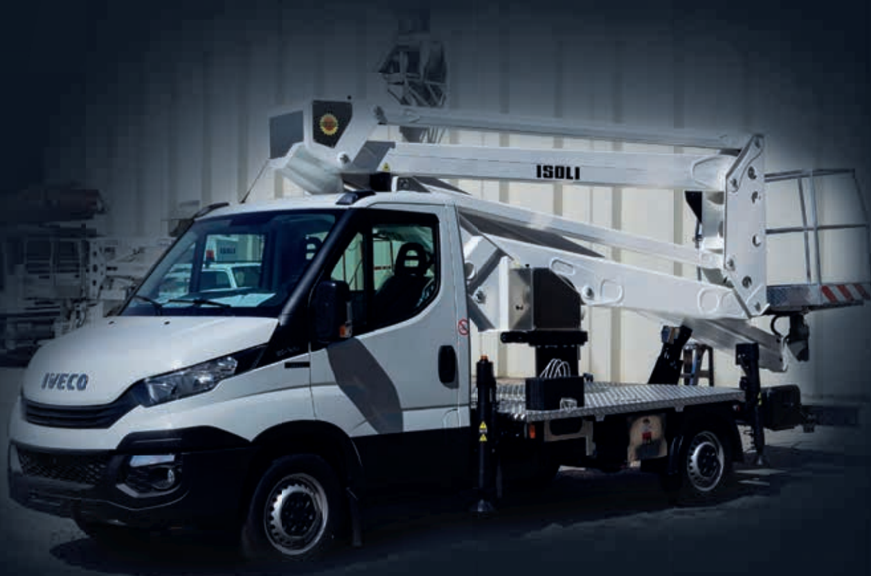
ISOLI PNT 215HE3 – Gelenk-Teleskop auf IVECO Fahrgestell